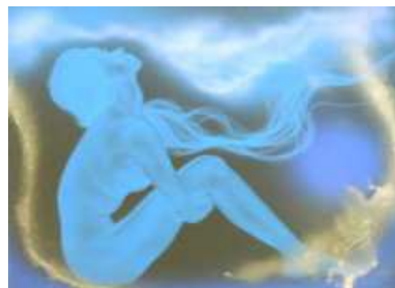
Femme assise" d' Huard

Remarque : ce soin est un instant de douceur que vous vous offrez, pas une bataille pour appuyer là où cela fait mal !! Soyez bienveillants avec vous-même considérez ceux qui vous portent, sans jamais défaillir, avec amour et reconnaissance.